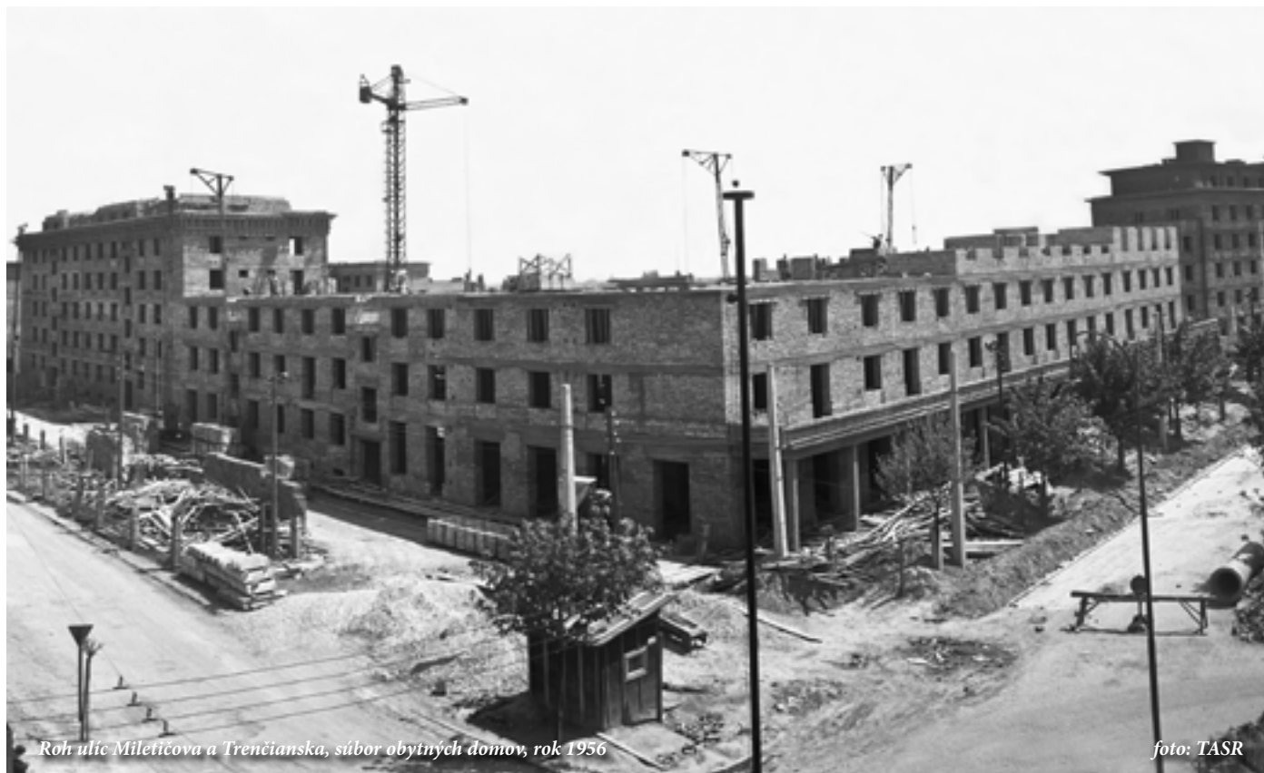
Roh ulíc Miletičova a Trenčianska, súbor obytných domov, rok 1956

Obvod s najromantickejším názvom sa vyznačuje nielen historicky dôležitým komplexom na spracovanie mäsa, ale aj architektonicky unikátnymi fasádami obytných domov. Neodmysliteľne sa s ním spája aj najznámejšie bratislavské trhovisko, ktoré je s históriou Ružovej doliny prepojené viac, než ste možno tušili. A to, že je rozlohou a počtom obyvateľov najmenšou časťou Ružinova, jej na originalite a rozmanitosti vôbec neuberá.